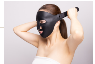
④コイルが極力顔全体に当たるように引っ張ります。