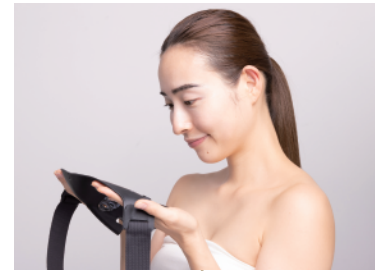
①両手にマスクを広げて持ちます。