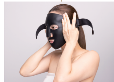
③目鼻の位置を合わせ装着します。