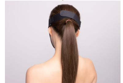
⑤後ろ斜め上にやや引っ張り上げるようにマジックテープを止めます。