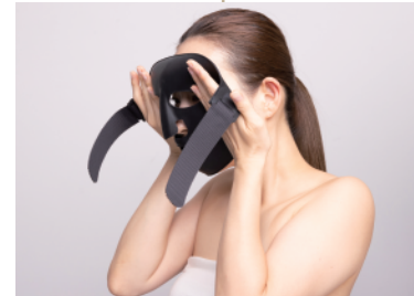
②目鼻の位置を確認しながら装着します。