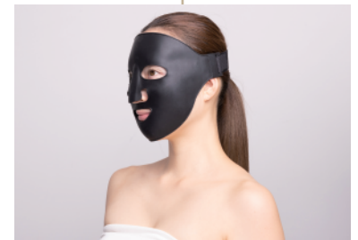
⑥最後にお顔全体になじむように調整ください。